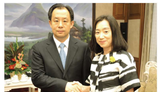
黒龍江省の陸省長と