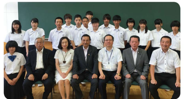
米沢東高等学校の生徒さんと参加した県議会議員

山形県が全国でどのようなポジションにあるのか、山形県の価値はどこにあるのかという視点は本当に素晴らしいと思いました。祖母との経験から一人暮らしの高齢者の現状について尋ねた心優しい男子高校生の姿も印象的でした。若者の発想を本県活性化のためにもっと活用すべきです。