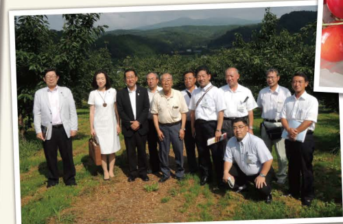
▲一面に広がるさくらんぼ畑 (北海道余市町)