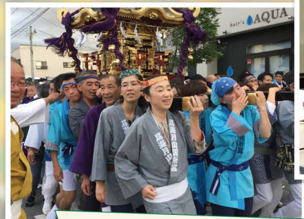
はじめてのお神輿 地域の皆様との一体感に感激しました。