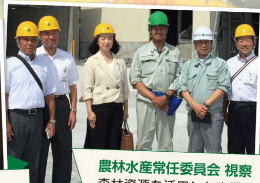
農林水産常任委員会 視察 森林資源を活用した事業や木質バイオマス発電事業を展開している企業訪問。