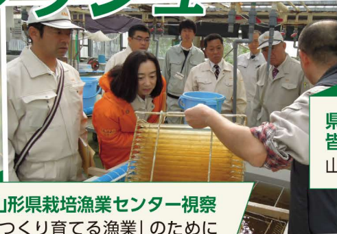
山形県栽培漁業センター視察 「つくり育てる漁業」のために素晴らしい技術開発が行われています。