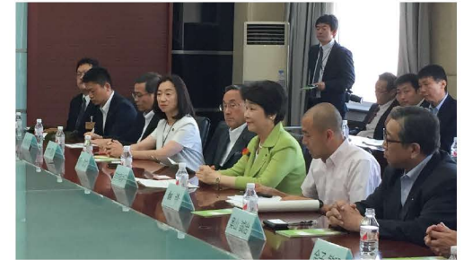
ハルビン市内 東北林業大学での意見交換会

尚、民間における上海—庄内空港間のチャーター便就航の実現に協力すると共に、外国クルーズ船の誘致にも努めていきたい。