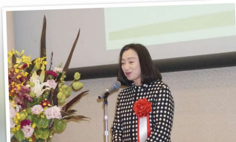
山形県土地改良大会 農林水産常任委員長としてご挨拶させていただきました。