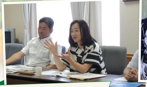
農林水産常任委員会 県外視察 意見交換では時間が足りないこともしばしば…。