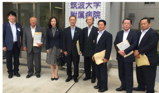
検討委員会のメンバーと先進地視察