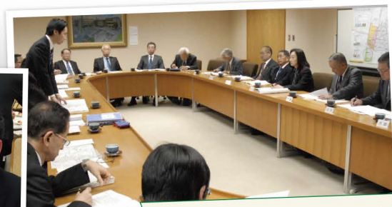
地域の皆様と共に要望活動 地域と行政、議員が共に知恵を出しあい解決できる体制を目指して。