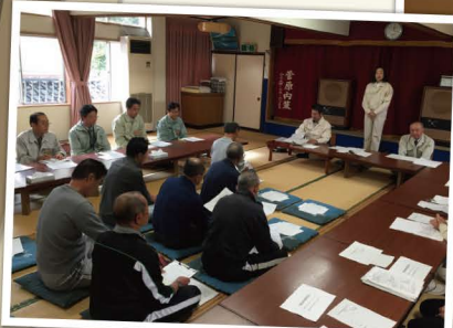
▲漁業組合との意見交換 (酒田市飛島)