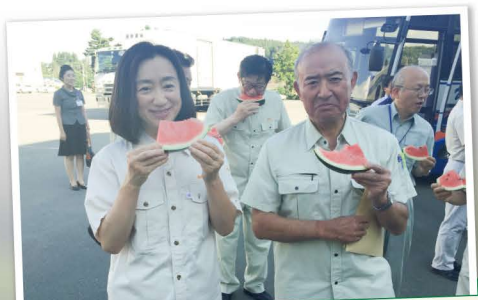
尾花沢市の東部すいか選果施設視察 新しい選果施設がオープンし、美味しいスイカが効率よく市場へ。