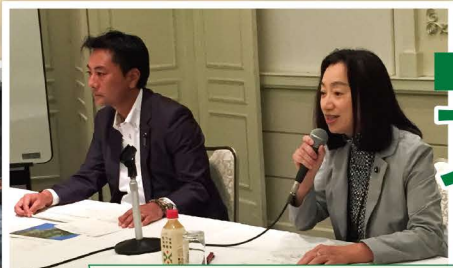
宮城・山形県議会交流議員連盟の意見交換 「県境周辺の連携強化や交通網の整備について」の分科会で座長をつとめました。