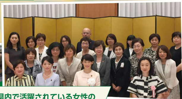
県内で活躍されている女性の皆様との意見交換会 山形の女性は底力があると実感!