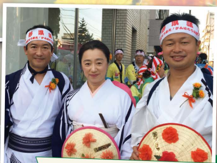
今年も踊りました!山形県議団 治道からのご声援ありがとうございます。