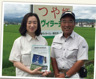
▲つや姫ヴィラージュ (寒河江市)