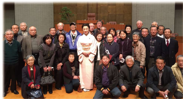
平成29年2月定例会 着物議会での一般質問を傍聴して下さった皆様と共に

これまで以上に県民の皆様のお声に耳を傾け、県民の幸せのために精一杯の力を尽くしてまいります。