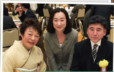
県民のご功績に感謝 多くの祝賀会に出席させていただいております。